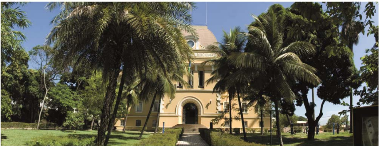
Museu de Astronomia e Ciências Afins